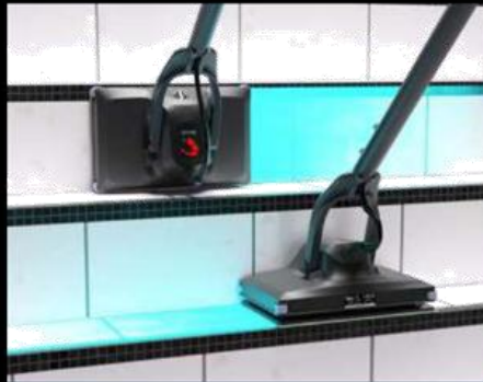
Rychlé a bezpečné čištění schodů