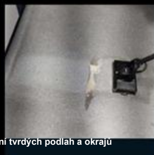
Čištění tvrdých podlah a okrajů

Rám z tlakově lité zinkové oceli o tloušťce 5 mm v kombinaci s oscilační pohonnou jednotkou z litého hliníku. SHOCK je navržen pro dlouhou životnost – více než 1 500 hodin testování bez poruch.