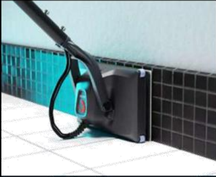
Otočte svisle pro čištění podlahových lišt