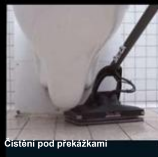
Čištění pod překážkami