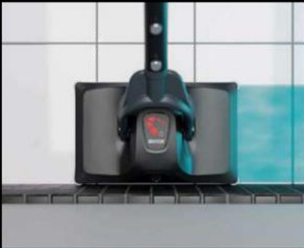
Precizní čištění podél okrajů