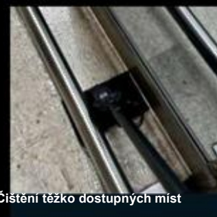
Čištění těžko dostupných míst